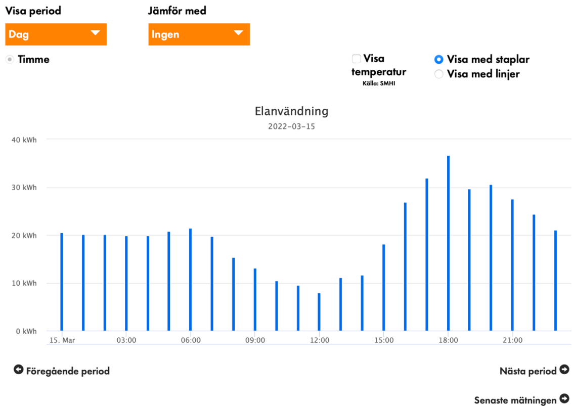
Diagram som visar vår (Brf Magnolian) energiförbrukning per timma den 15/3 2022

Diagram (3) visar vår elförbrukning den 15 mars. Störst är förbrukningen på eftermiddagen och kvällen.